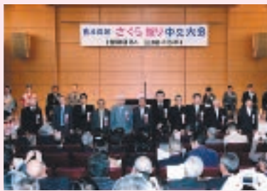
表彰式の様子【会場：憲政記念館(国会議事堂前)】